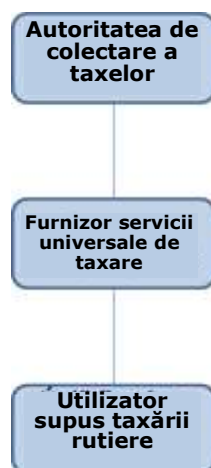
Figura 1 Raportul contractual dintre autoritatea de colectare a taxei rutiere, furnizorul de servicii universale de taxare rutieră și utilizatorul obligat la plata taxei rutiere

Raportul contractual dintre autoritatea de colectare a taxei rutiere, furnizorul de servicii universale de taxare rutieră și utilizatorul obligat la plata taxei rutiere este ilustrat de următorul grafic: